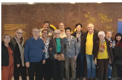
EXPOSIÇÃO OLAVO SETUBAL