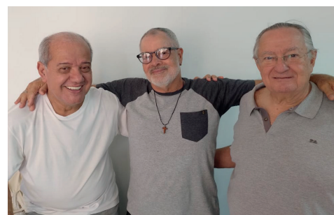
REGIONAL RIO DE JANEIRO