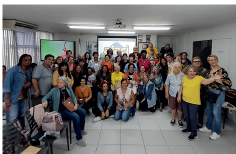
BINGO DA PRIMAVERA